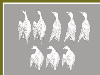
Пример 3: Группировка по внешнему виду