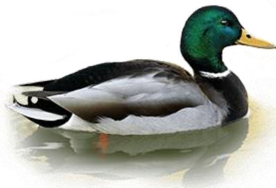
Селезень кряквы (Anas platyrhynchos)

Мы обращаемся к Вам с убедительной просьбой ответить на вопросы, приведенные на обороте этого листа. Ваши ответы помогут оценить объем добычи одного из самых популярных объектов охоты – кряквы. Пожалуйста, укажите точное количество отстрелянных Вами селезней кряквы по итогам весеннего сезона. Важны все результаты, поэтому заполните эту анкету даже в тех случаях, когда Вы получили разрешение на добычу селезней уток, но не охотились, или же Вам не удалось отстрелять ни одного селезня кряквы.