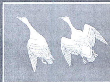
Пример 1: Варианты расположения